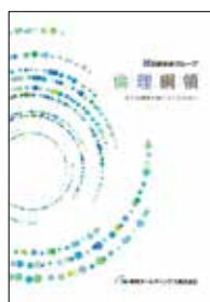
「共創未来グループ倫理綱領」

この倫理綱領は、グループスローガンや経営理念に基づき、全社員の業務活動における行動指針を定めたものです。また、医薬品医療機器等法、独占禁止法、景品表示法とそれに基づく医療用医薬品卸売業公正競争規約などの重要法規を遵守するためのポイントも解説しています。この倫理綱領を全社員(契約社員、派遣社員、アルバイト、パートタイマーを含む)に配付し、さらに各事業所に常備して業務委託先のスタッフにも周知を徹底しています。